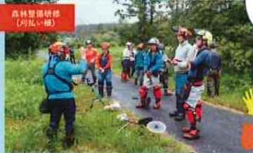
森林整備研修 (刈払い機)