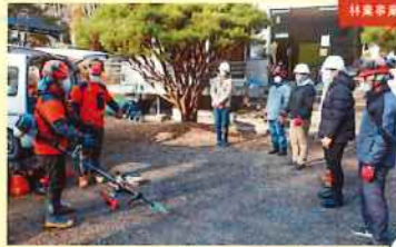
林業事業者と訪問