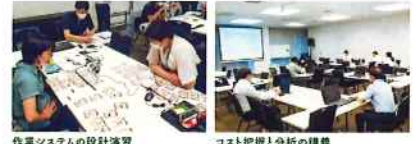
作業システムの設計演習