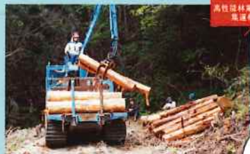
高性能林業機械による 集材研修

【対象】 ●林業事業体に就職した方が、段階的・体系的に スキルアップを回っていきます。(3年間) 【内容】 フォレストワーカー ●1年目: □チェーンソー業務 □玉掛技能など ●2年目: □車両系運搬機械 □はい作業従事者など ●3年目: □簡易架線集材 □伐木等機械運転 など