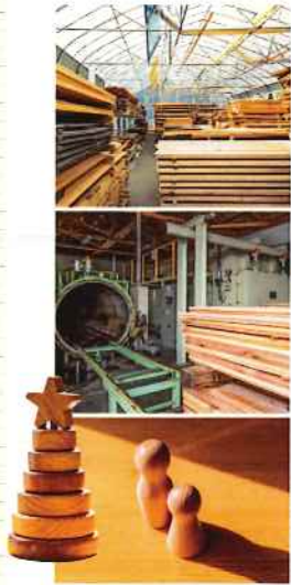
登米市木材生産協議会で管理・生産された木材(広葉樹)から、デザイナーやグラフィック作家たちとのコラボで生み出された家具や木製品も多岐です。