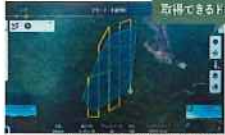
傾斜・距離を加算した飛行計画を作成