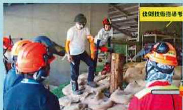
伐倒技術指導者養成研修

【対象】●林業事業体に就職した方 安全で正しい伐倒技術を指導できる人材を育成します。 伐倒技術指導者養成研修(3年制) 【開催時期】4～6月(22日間程度)※予定 【場所】宮城県林業技術総合センターなど 高性能林業機械のメンテナンスに対応できる人材を育成します。 高性能林業機械メンテナンス技術研修 【開催時期】9～10月(各1日×2回)※予定 【場所】多賀城市