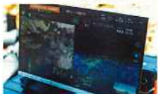
収集したデータを3次元でマッピング