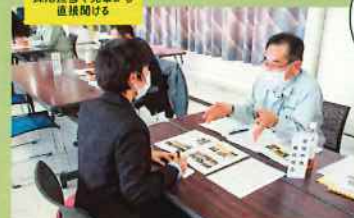
採用担当や先輩から 直接聞ける