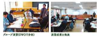
グループ演習(SWOT分析)