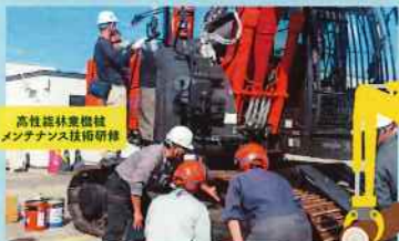
高性能林業機械 メンテナンス技術研修