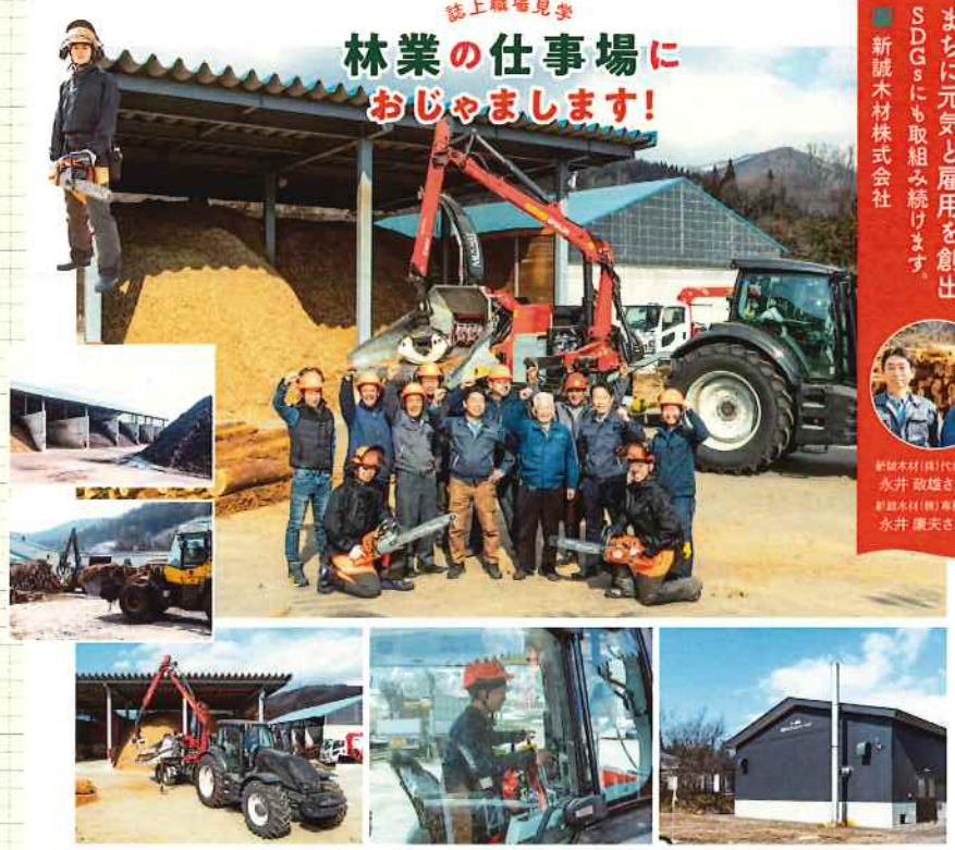
バイオマスチップは、木質バイオマスボイラーの燃料として、まちの暖かいスポット(なないろひろば)内の入浴施設や敷地内のロードヒーティングにも活用されています。

2024年1月には、市内の軽装スポットと山を自転車で巡るツアー企画もスタートします。新しい試みにご注目ください。