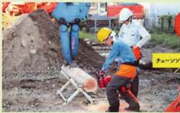
チェーンソー資格講習